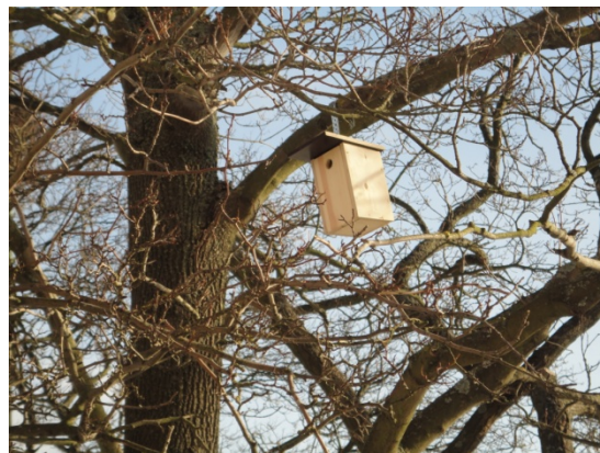
I väntan på invånare.....

Tack till er som parkerar er bil i rutan så att grannens förare kan komma i och ur sin bil utan svårigheter. Bilarna är större nu än då parkeringsplatserna markerades. 30-min. parkeringarna vid P4 och mellan P3 och P5 är avsedda för i och urlastning.