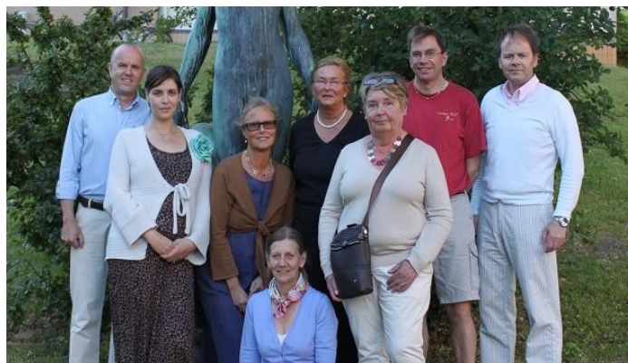
Vår nya styrelse framför jaktgudinnan Diana.

Expeditionen är även fortsättningsvis bemannad av