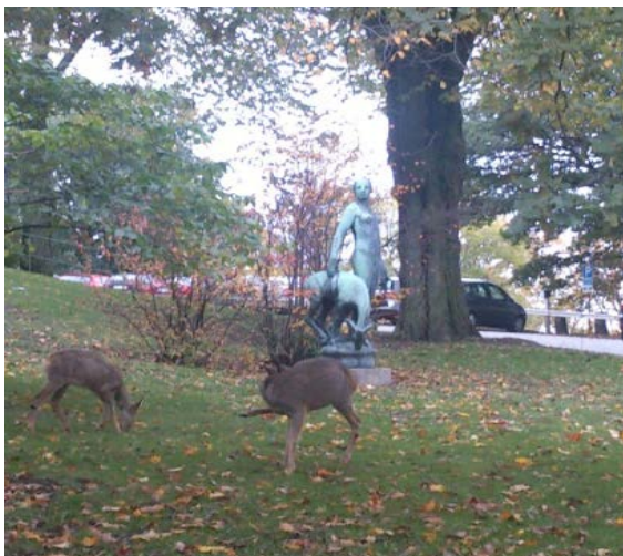
taget i nov.

ska bli längre. Hissarna ska inte vända och gå ner igen lika snabbt som de nu gör.