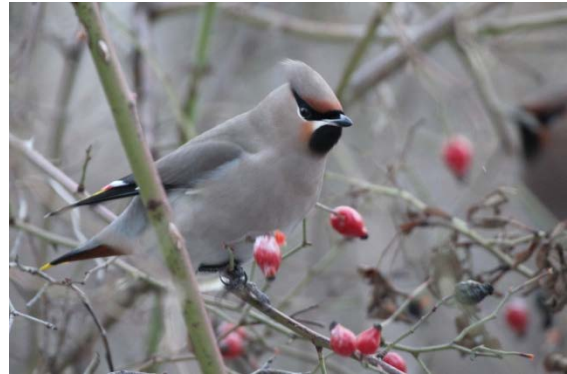
Längst nere på Pokalvägen tog Anders Bjärvall, P3, den här bilden på en sidensvans som äter nypon 17 januari i år.

Ett byte av värmeväxlare m.m. i den s.k. undercentralen (gamla pannrummet), som förser alla våra hus med värme, kommer att göras under sommaren.