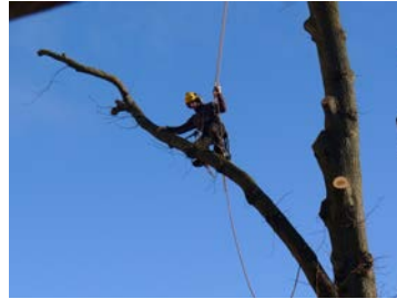
När arborister är i farten.